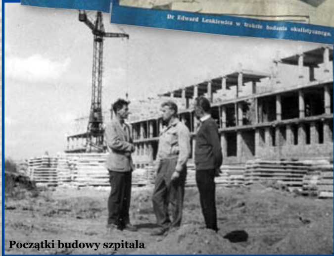
Początki budowy szpitala