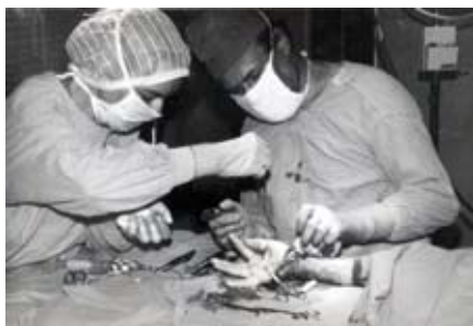
Operacja przyszczenia ręki