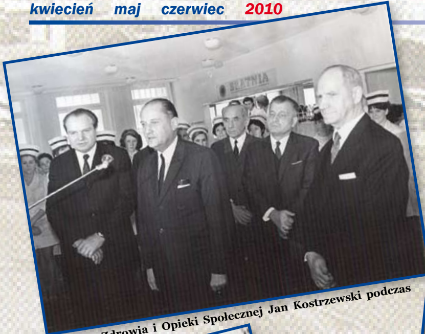
Minister Zdrowia i Opieki Społecznej Jan Kostrzewski podczas otwarcia szpitala