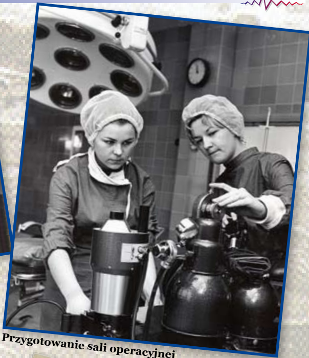
Przygotowanie sali operacyjnej