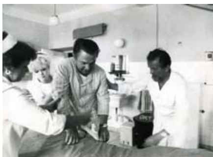
Na oddziale ortopedii...