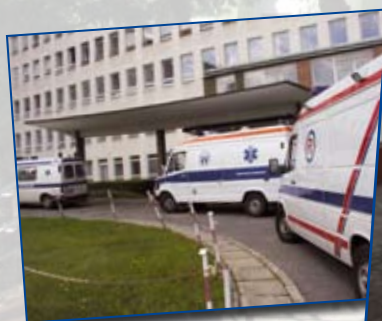
wiata przed sor