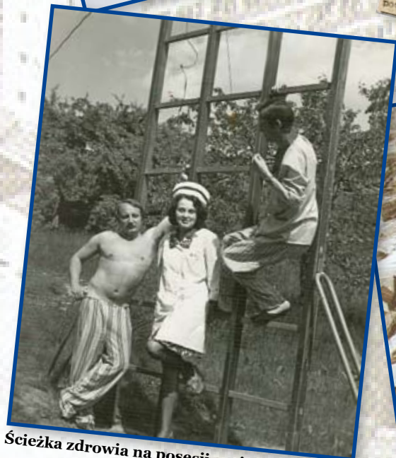
Ścieżka zdrowia na posesji szpitala