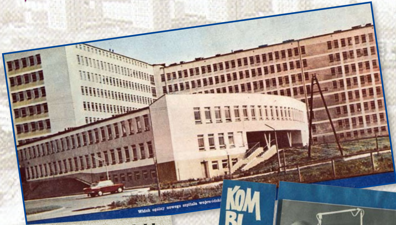
Widok ogólny nowego szpitala wojewódzkiego