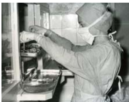
Przygotowanie narzędzi do zabiegu