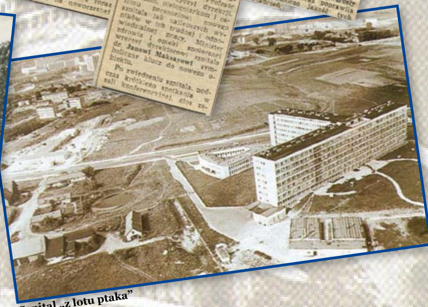
Szpital „z lotu ptaka”