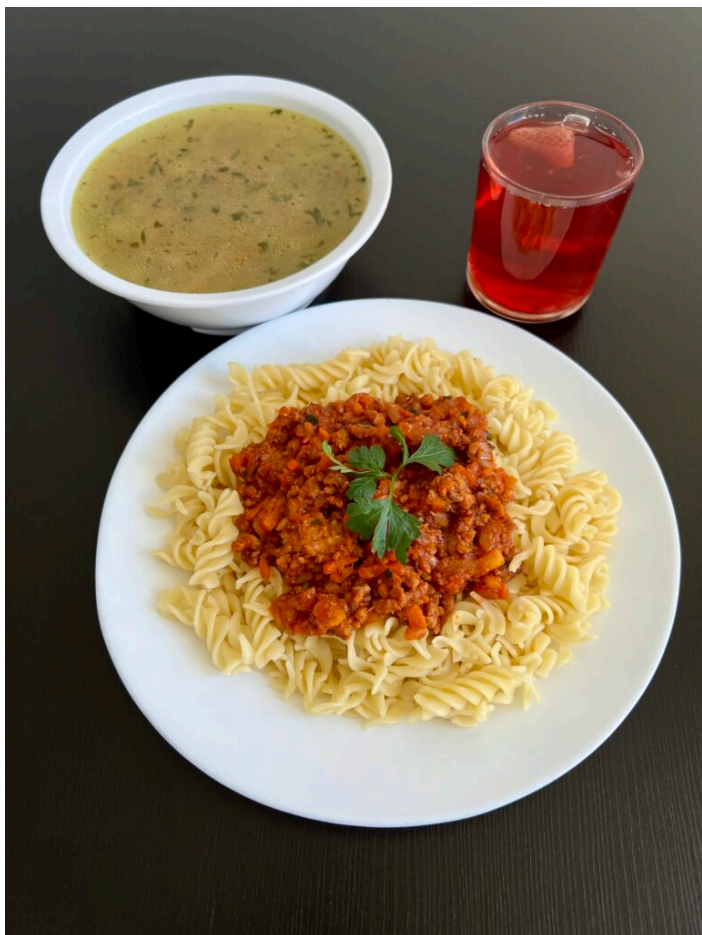
Zupa koperkowa z ziemniakami / Sos bolognese duszony z warzywami z mięsem wieprzowym / Makaron pełnoziarnisty ugotowany al dente / Kompot