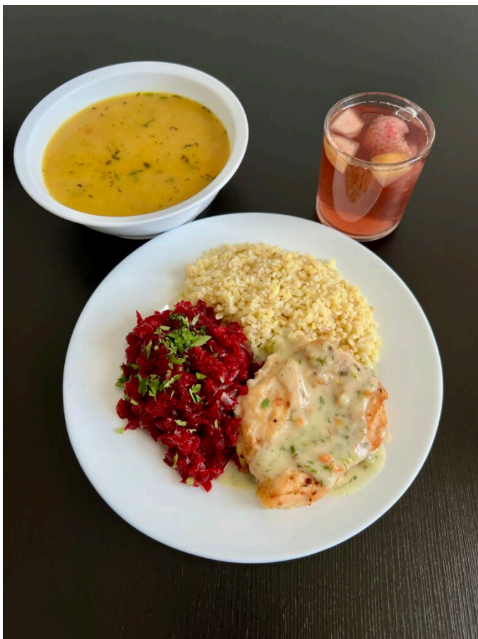
Zupa dyniowa / filet z kurczaka duszony w sosie / sos koperkowy / kasza bulgur gotowana / surówka z buraków z cebulką / kompot