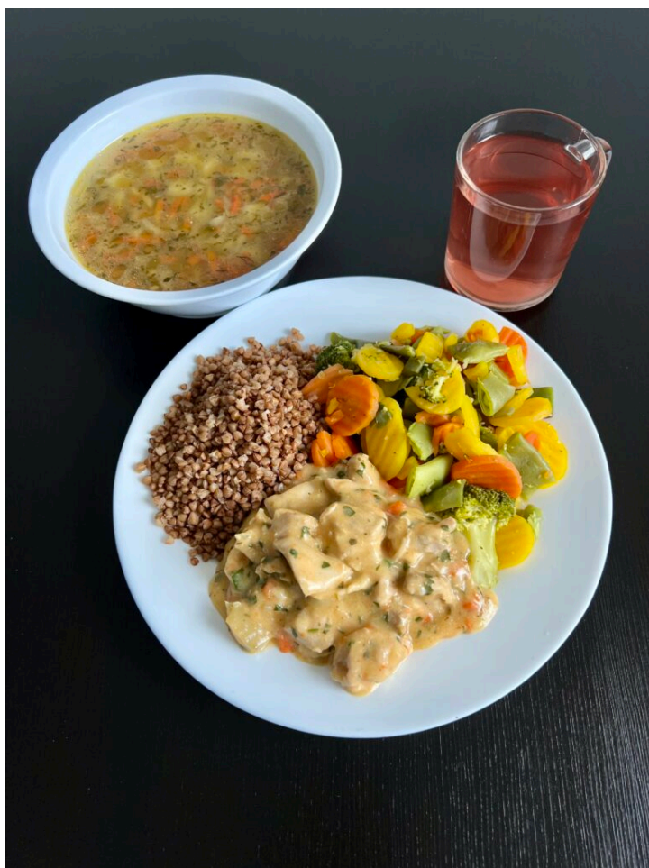
Zupa ogórkowa ze świeżych ogórków / gulasz z udźca drobiowego / kasza gryczana / gotowane warzywa / kompot