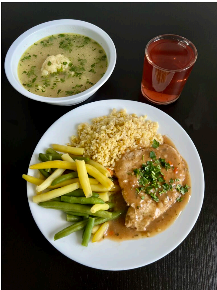
Zupa kalafiorowa / bitka schabowa duszona w sosie własnym / kasza bulgur gotowana / fasolka szparagowa gotowana / kompot