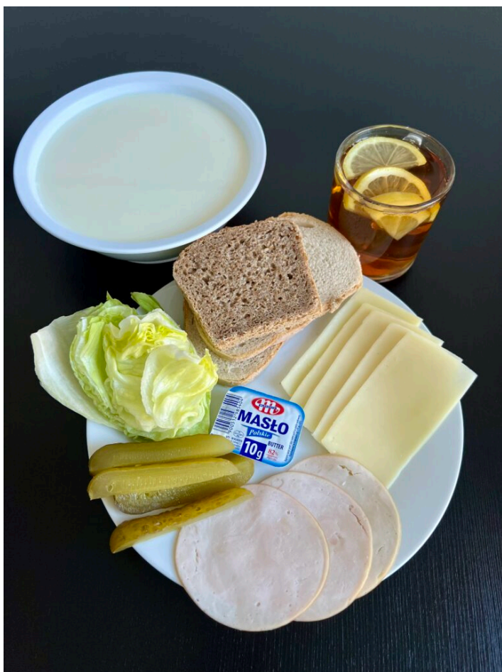
Zacierka na mleku / chleb pszenny / chleb razowy / ser żółty / szynka dębowa drobiowa / ogórek kiszony / sałata / masło / herbata z cytryną