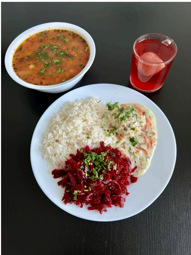
Zupa solferino / pulpet z szynki duszony w sosie koperkowym / ryż / surówka z buraczków / kompot