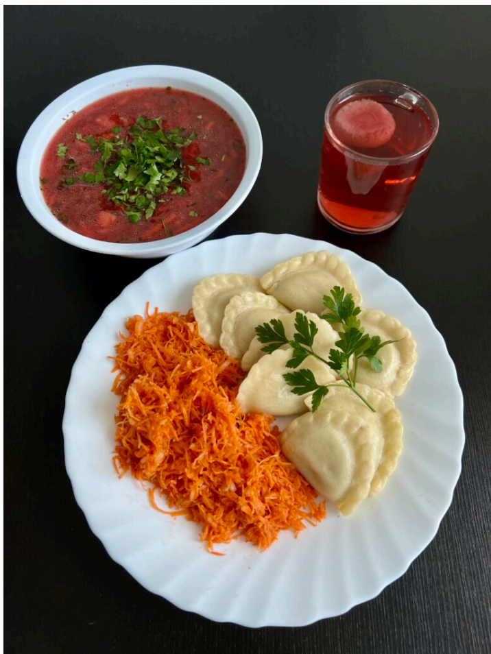
Zupa buraczkowa / pierogi z mięsem / surówka z marchewki / kompot