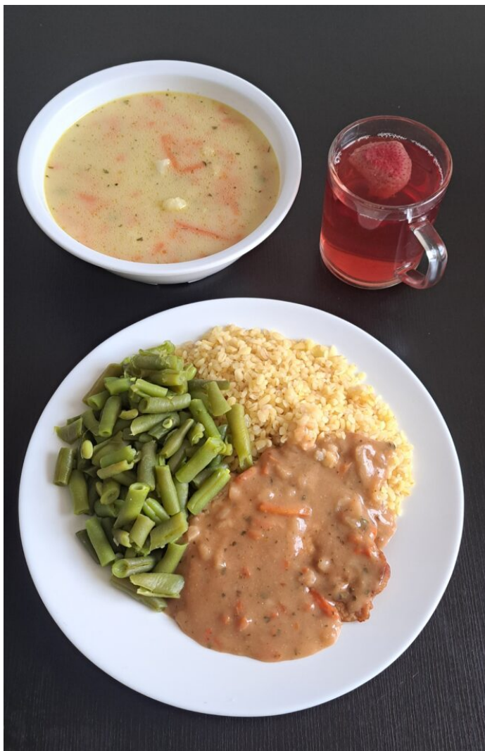
Zupa kalafiorowa / Bitka schabowa duszona w sosie własnym / kasza bulgur / fasolka szparagowa / kompot