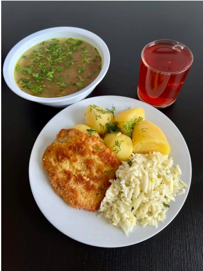
Zupa krupnik / kotlet schabowy / ziemniaki gotowane / surówka z porem / kompot