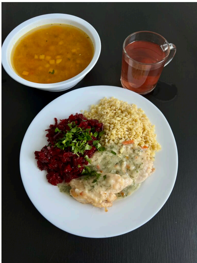
Zupa dyniowa / filet z kurczaka duszony w sosie koperkowym / kasza bulgur / surówka z buraków / kompot