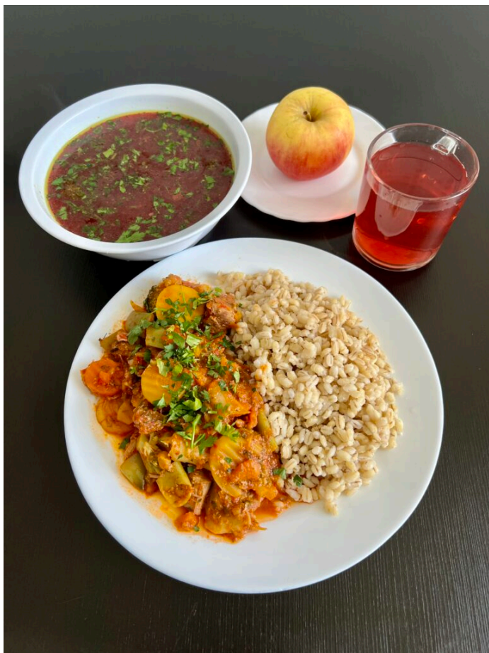
Barszcz czerwony / ratatuj duszone z indyka / kasza pęczak / kompot / jabłko