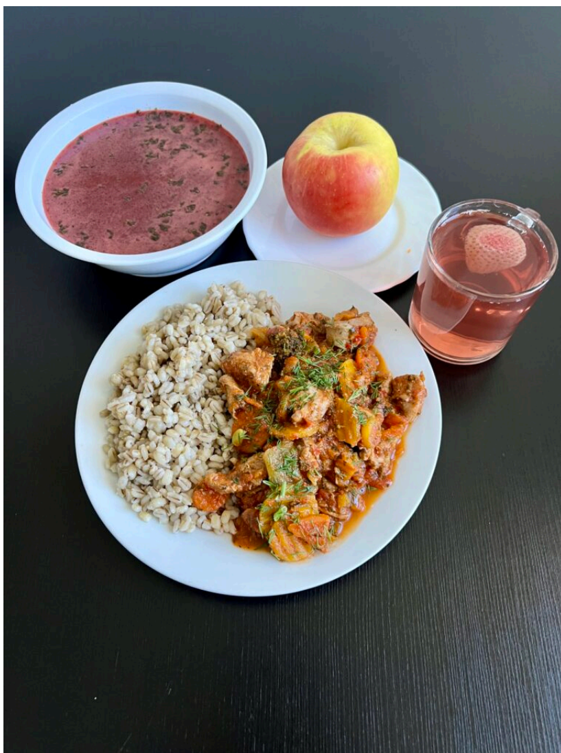
Zupa barszcz czerwony / ratatuj duszone z indyka / kasza pęczak / kompot / jabłko