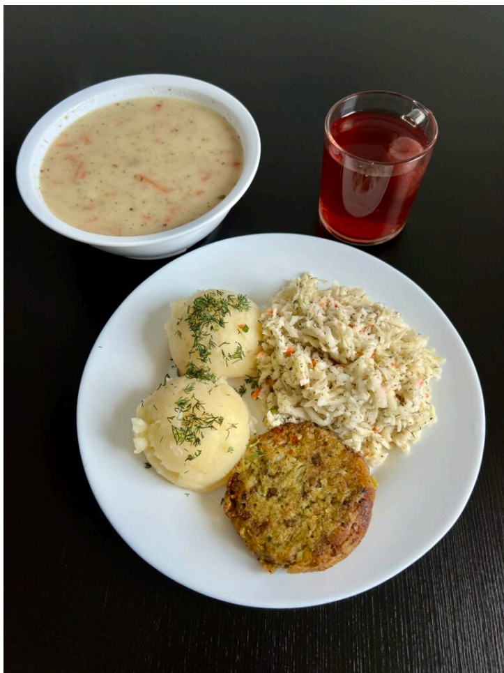
Zupa barszcz biały / kotlet warzywny pieczony / ziemniaki gotowane / surówka koperkowa / kompot