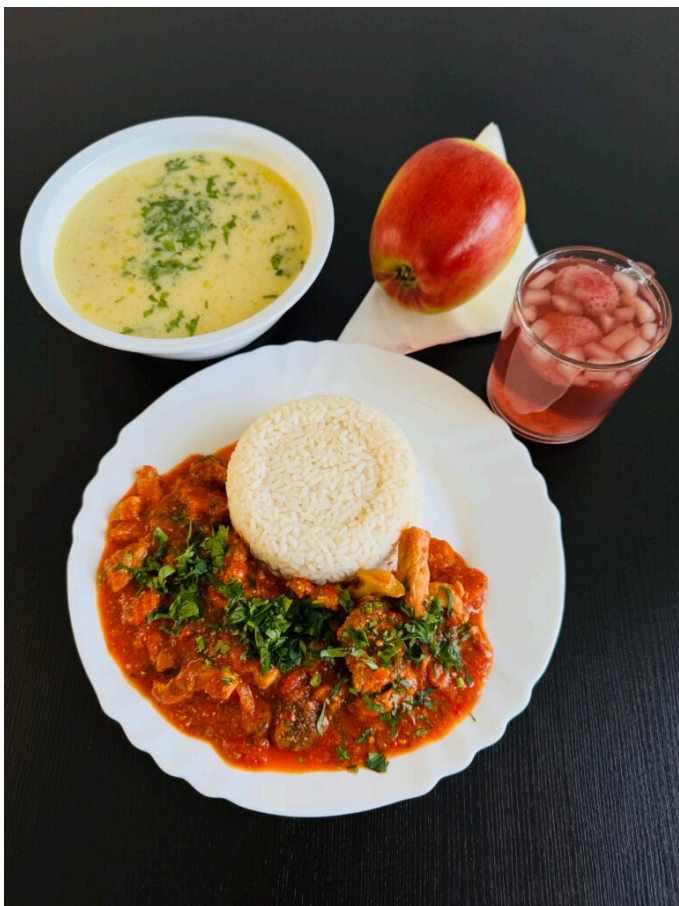
Zupa koperkowa z ziemniakami / Strogonow ze schabu duszony z warzywami / ryż al dente / jabłko / kompot