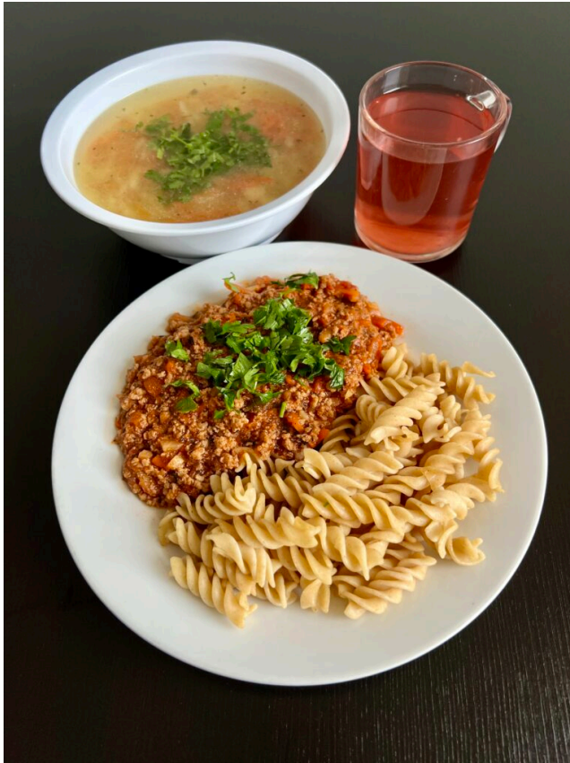
Krupnik / Sos bolognese duszony z warzywami i mięsem wieprzowym / makaron pełnoziarnisty / kompot /