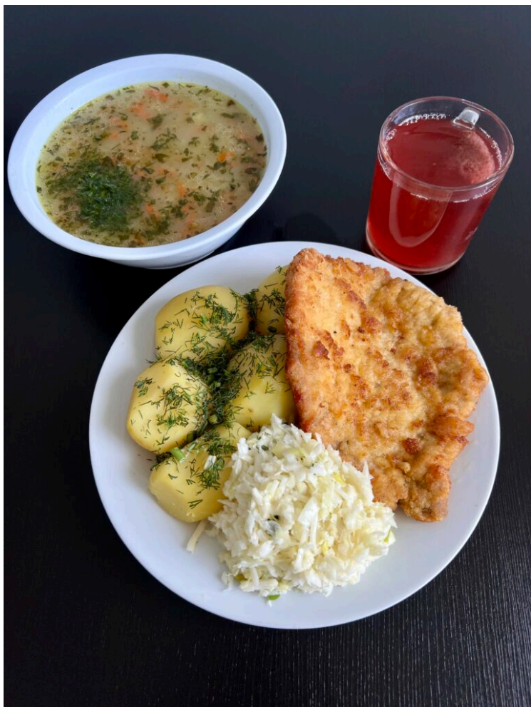
Zupa krupnik / kotlet schabowy / ziemniaki gotowane / surówka z porem / kompot