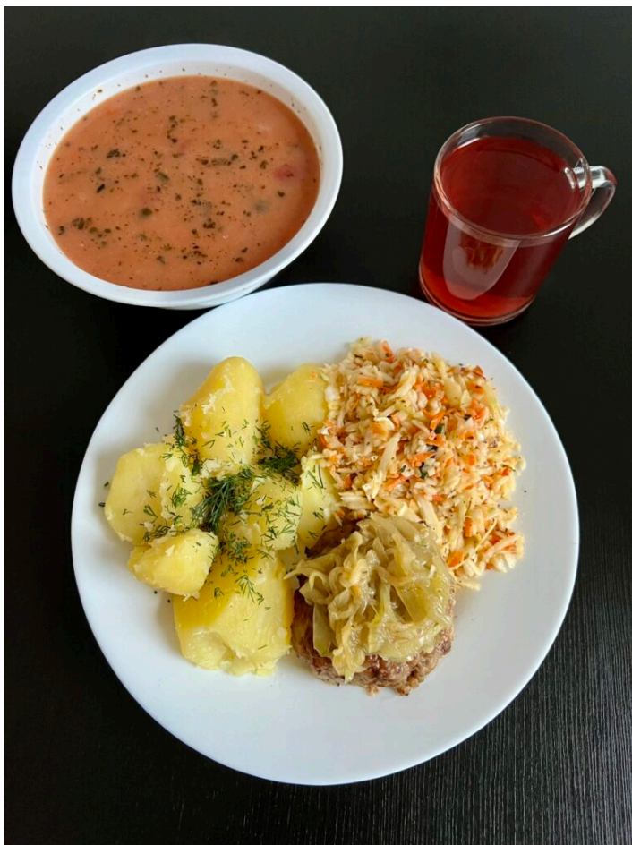
Zupa pomidorowa z ryżem / stek z cebulką / ziemniaki gotowane / surówka z ogórkiem / kompot / mandarynki