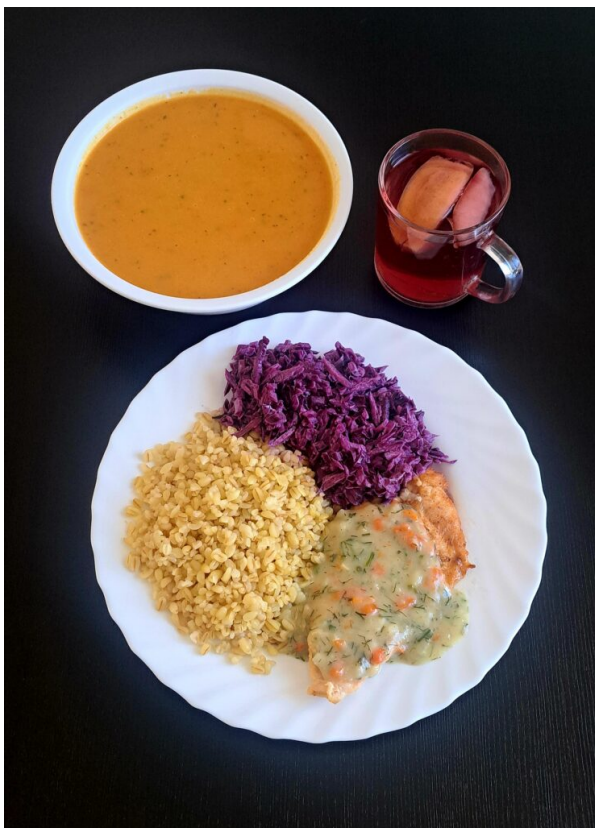
Zupa dyniowa / Filet z kurczaka duszony / sos koperkowy / kasza bulgur gotowana / surówka z czerwonej kapusty / kompot