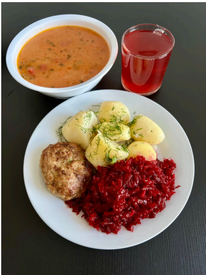
Zupa pomidorowa z makaronem / kotlet mielony wieprzowy / ziemniaki gotowane / surówka z buraków z cebulką / kompot