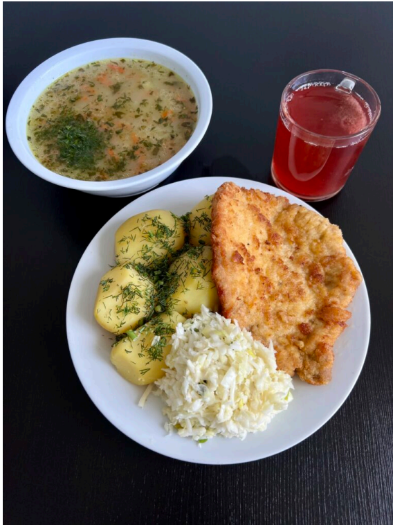
Zupa krupnik / Kotlet schabowy / ziemniaki gotowane / surówka z porem / kompot