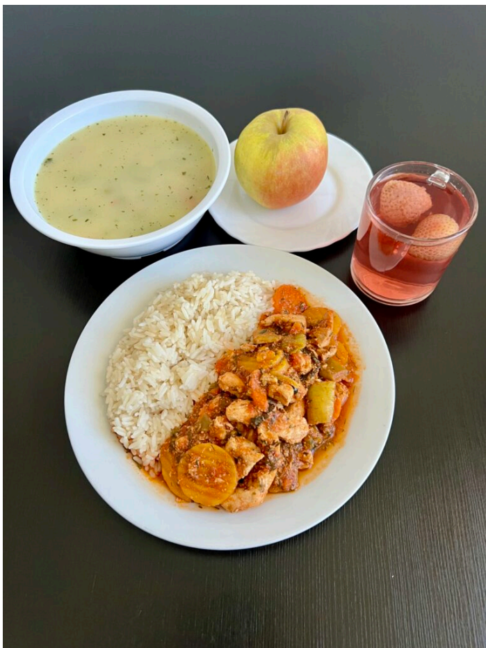
Zupa z fasolką szparagową / strogonow ze schabu duszony z warzywami / ryż / jabłko / kompot