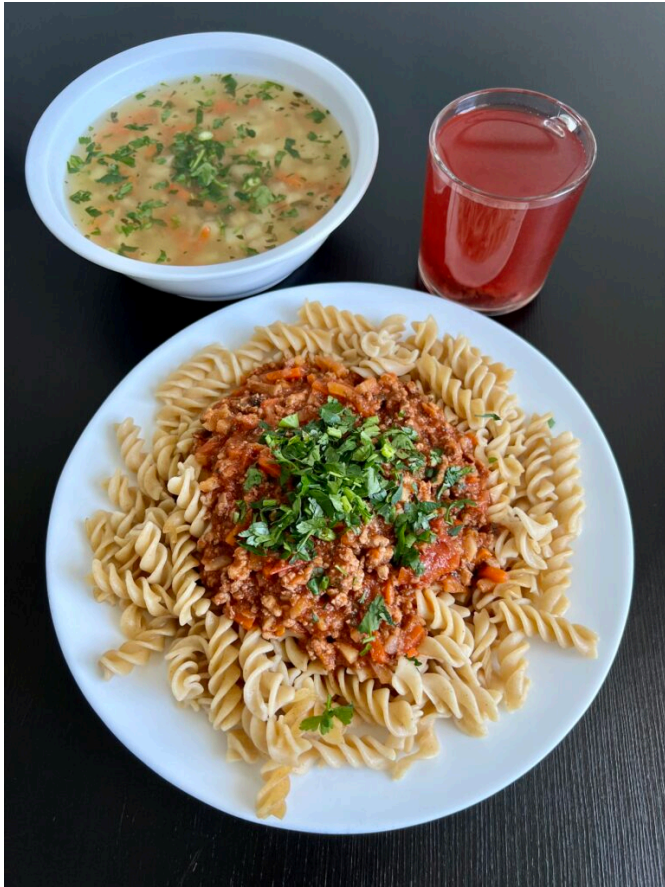
Zupa selerowa / sos bolognese duszony z warzywami z mięsem wieprzowym / makaron pełnoziarnisty / kompot