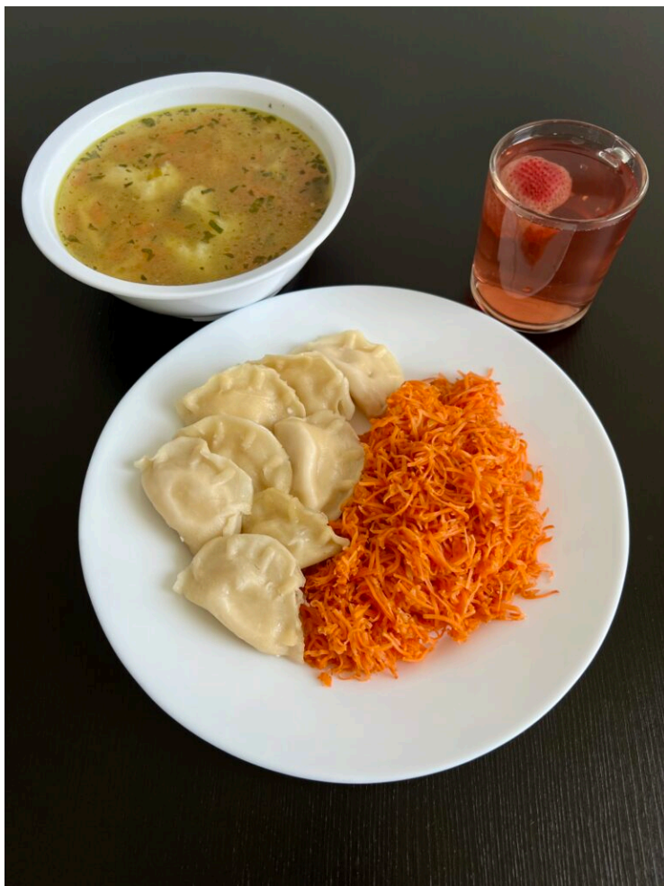
Zupa kalafiorowa / pierogi ruskie / surówka z marchewką / kompot