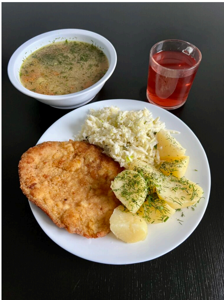
Krupnik / kotlet schabowy panierowany / ziemniaki gotowane / surówka z pora / kompot